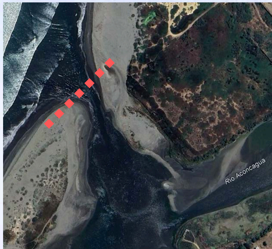
Figura 1. Humedales costeros sujetos al manejo de barra terminal, Región de Valparaíso.