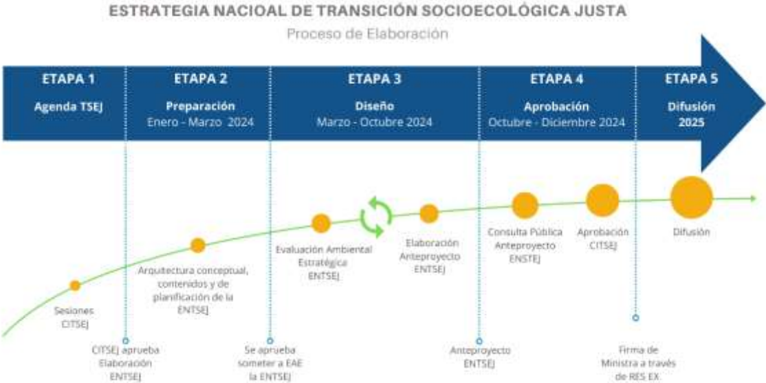
Figura 1: Proceso de Elaboración ENTSEJ (Elaboración propia)

La elaboración de esta Estrategia Nacional de Transición Socioecológica Justa (ENTSEJ) nace por mandato del Comité Interministerial de Transición Socioecológica Justa (CITSEJ), el que recae en la Oficina de Transición Socioecológica Justa (OTSEJ) del Ministerio del Medio Ambiente, encargada de liderar este proceso. La elaboración de la ENTSEJ consta de cuatro etapas: preparación, diseño, aprobación y difusión. Además, considera una etapa previa denominada Agenda TSEJ, instancias donde miembros del CITSEJ iteraron sobre temas relevantes y consideraciones específicas de esta estrategia. A modo general este proceso puede visualizarse en el siguiente esquema.