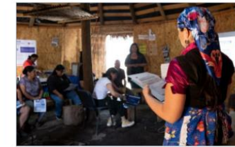
28 DICIEMBRE, 2023 Diez talleres con pertinencia cultural se han desarrollado en el marco de la Consulta Pública de Plan de Implementación de Escazú