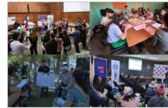
12 FEBRERO, 2024 Finalizó Consulta Ciudadana para la Implementación del Acuerdo de Escazú en Chile