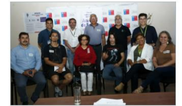
28 DICIEMBRE, 2023 Ministerio del Medio Ambiente invita a realizar Cabildos Autoconvocados por Escazú