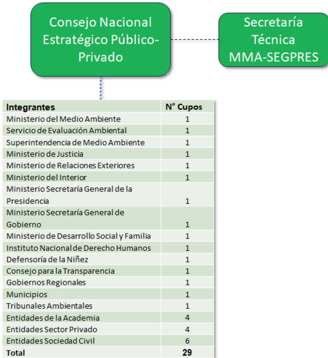
Figura 3: Consejo Nacional Estratégico Público-Privado, CNEPP.