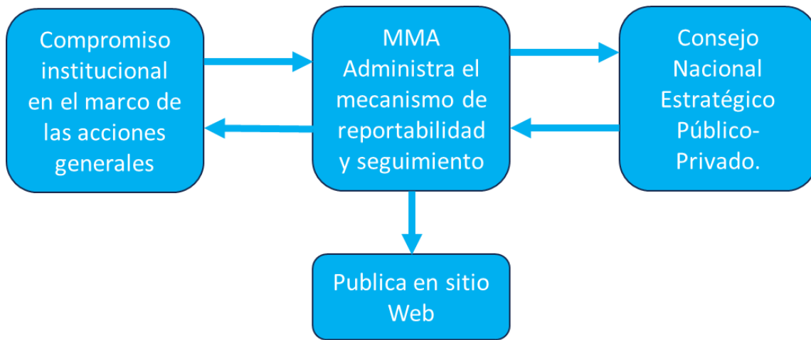
Figura 7: Flujo de reportabilidad y control