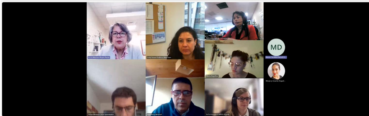
Reunión CCR -Presentación de la Norma Secundaria de Calidad de Aguas del río Maipo-20231122_094028-G