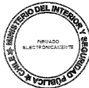
Rafael Prohens Espinosa