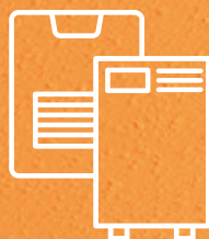
Calefactores a Gas y kerosene (parafina)