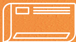
Aire acondicionado split

Se recomienda siempre realizar las mantenencias necesarias de acuerdo a las indicaciones del fabricante.