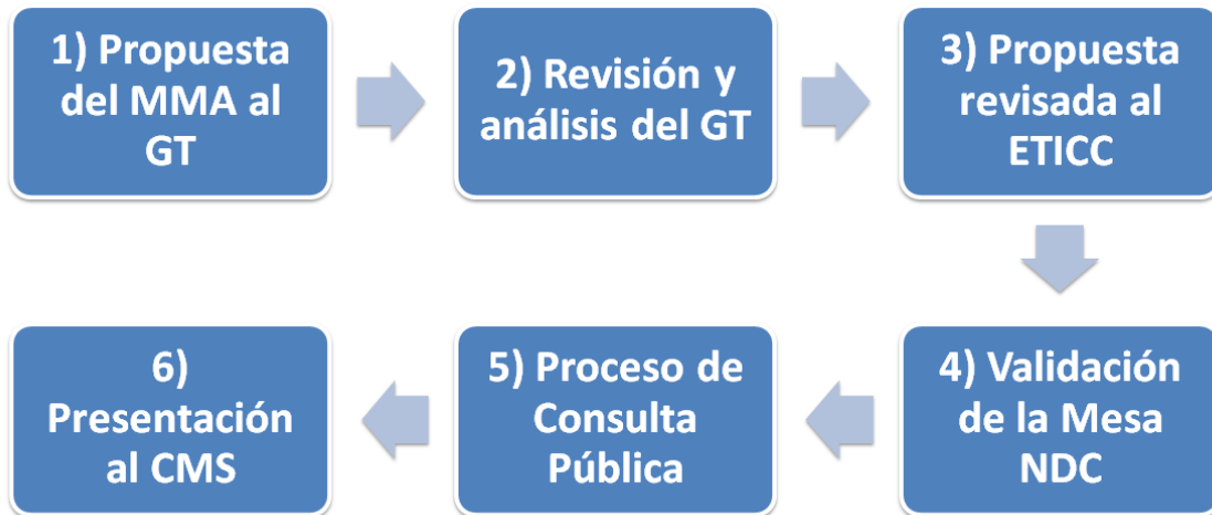
Figura 2: esquema metodológico de trabajo para la Mesa NDC

La metodología de trabajo seguirá el siguiente esquema, cuyas etapas se explican a continuación: