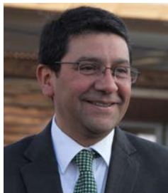
Pablo Badenier Martínez Ministro del Medio Ambiente

La nueva Ley de Fomento al Reciclaje, promulgada por la Presidenta Michelle Bachelet en mayo de 2016, busca crear una nueva industria en torno a esta actividad, y tiene además un carácter fuertemente inclusivo: entre sus objetivos está el incorporar en los nuevos sistemas de gestión de residuos a los cerca de 60 mil recicladores y recicladoras de base que existen en el país.